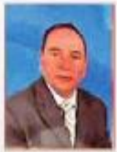
الإستاذ المعالي : الفيروز شوية