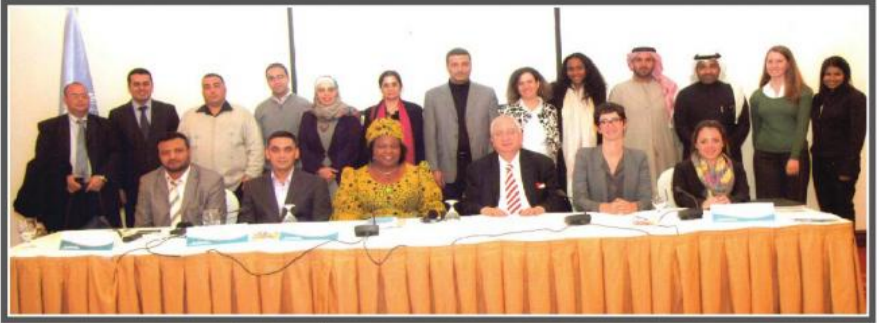
وزارة العدل تشارك في المشاورات الإقليمية المنعقدة في المملكة الأردنية بشأن :